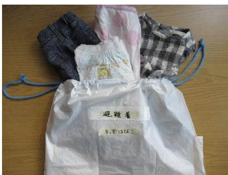
避難着（半期ごとに交換） （園預かり）