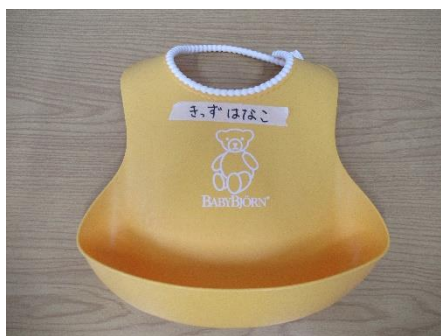
シリコン製エプロン （園預かり）