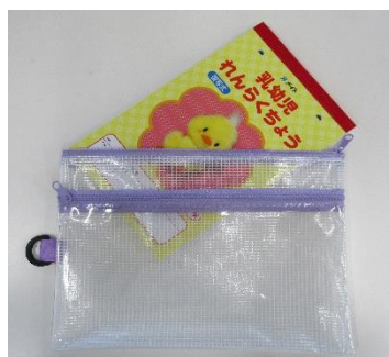
⑦お便り帳 （4月1日にお渡し）