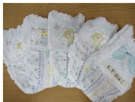
⑤紙おむつ（後方に記名）